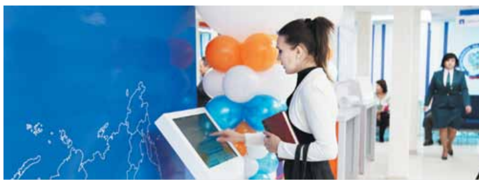
Налоговые инспекции края оборудованы в соответствии с современными тенденциями комфортного обслуживания.

В ходе мероприятия было организовано подключение всех желающих к «Личному кабинету налогоплательщика для