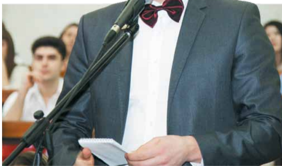
Участники налоговой олимпиады подготовили зрелищные выступления и задавали друг другу каверзные вопросы.

Кроме ставропольцев в олимпиаде приняли участие около 20 команд из вузов Москвы, Санкт-Петербурга, Краснодар, Ростова, Пятигорска, Дагестана, Чечни, Кабардино-Балкарии, Карачаево-Черкесии, Северной Осетии. Презентации команд показали владение темой, наличие глубоких и системных знаний, а также присущее студентам любых специальностей остроумие. Санкт-Петербургская команда даже недавнее северное сияние связала с экономическими процессами в стране. Неизменно высокий уровень показывают команды Ставропольского аг-