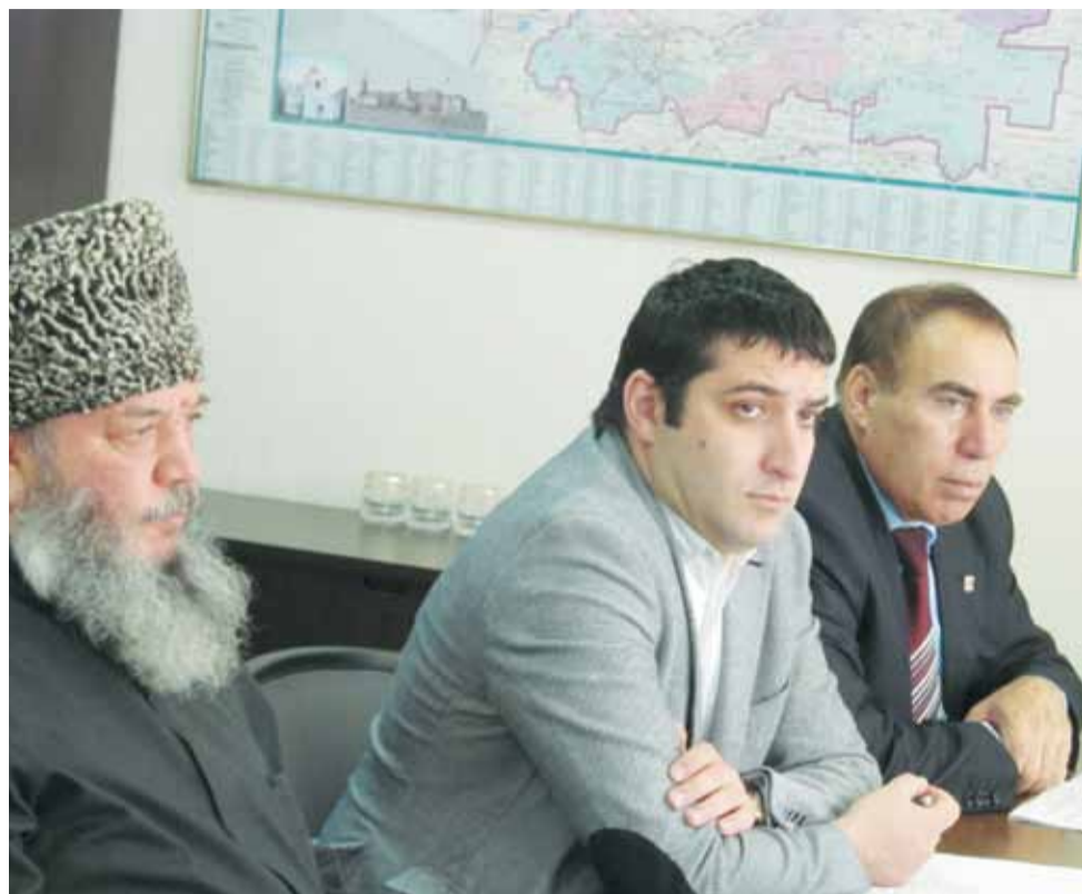
Члены Совета горячо обсуждали озвученную сотрудниками УФМС информацию.