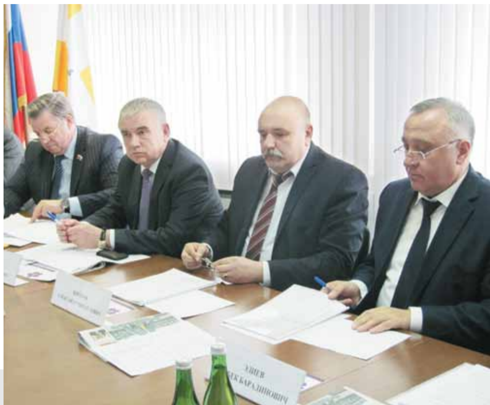
На Общественно-консультативном совете обсуждались вопросы, актуальные для региона в целом.